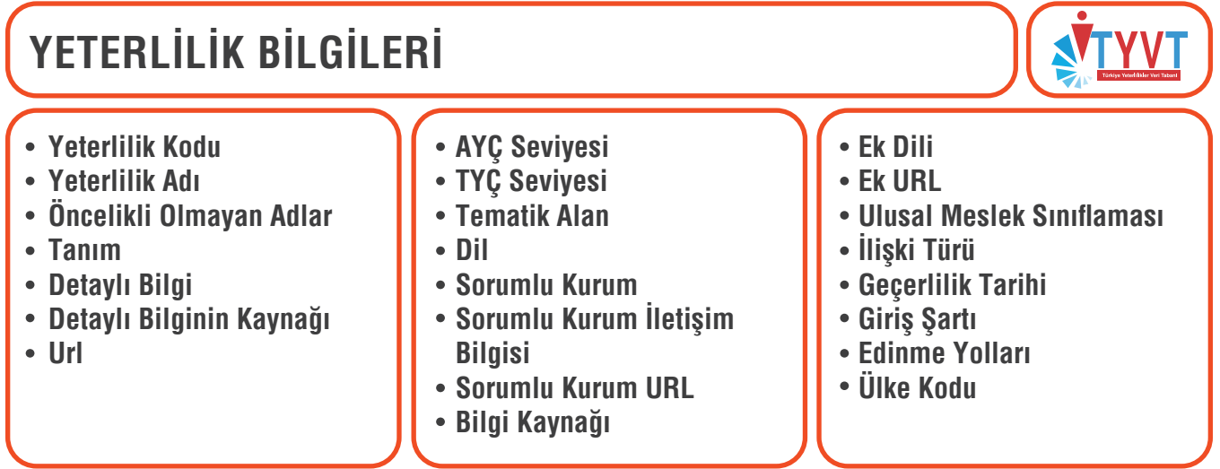
Şekil 3: TYVT'ye Eklenen Yeterlilik Bilgileri